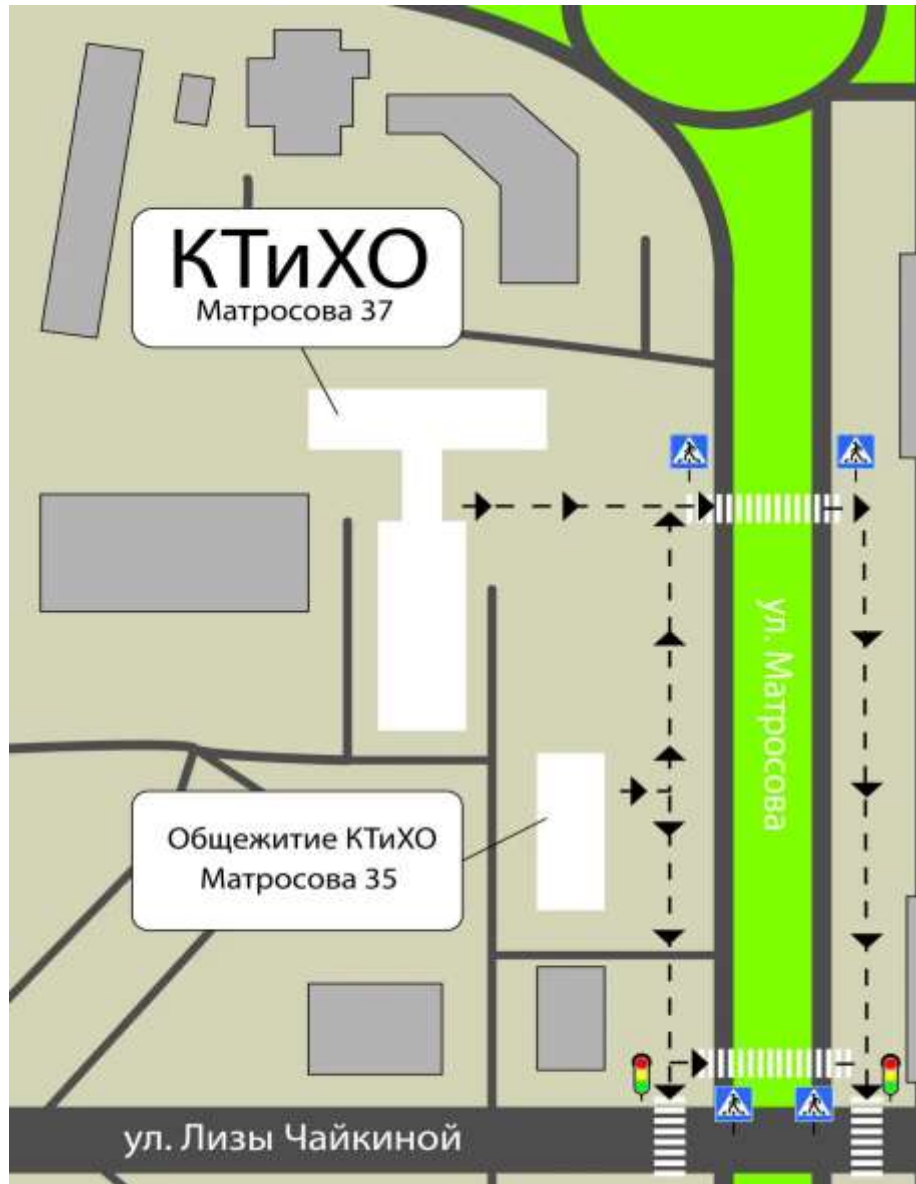
Схема расположения ГАПОУ КТиХО на ул. Матросова 37 (корпус – 2), относительно центральных улиц г. Тольятти, с указанием безопасного маршрута движения учащихся по регулируемым и нерегулируемым пешеходным переходам.